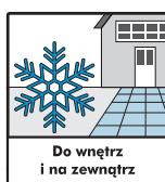
Do wewnątrz i na zewnątrz